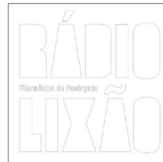
Rádio Lixão (2014)